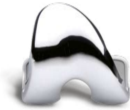
Gender Solutions™ High-Flex Oberschenkelkomponente

Mehr als zwei Drittel der Patienten, die ein künstliches Kniegelenk erhalten, sind Frauen. Wissenschaftliche Studien zeigen, dass zwischen männlichen und weiblichen Knien anatomische Unterschiede bestehen. Herkömmliche Knieimplantate, die hauptsächlich auf Daten der männlichen Anatomie beruhen, haben bei beiden Geschlechtern gute Ergebnisse gebracht. Um noch gezielter auf die speziellen Bedürfnisse und anatomischen Besonderheiten von Frauen einzugehen, wurde das