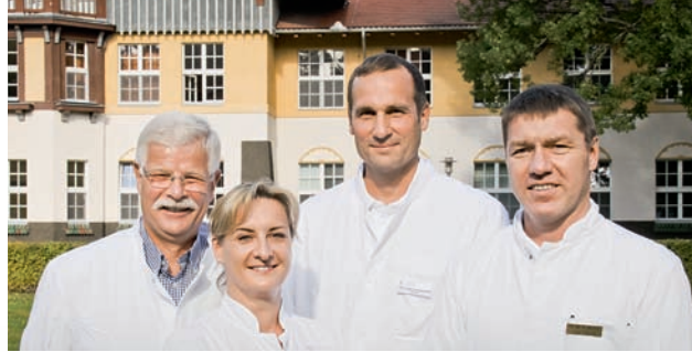
Ärzte team Wirbelsäulenchirurgie