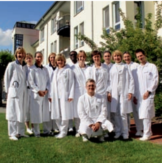
Ärzteteam der Rehaklinik